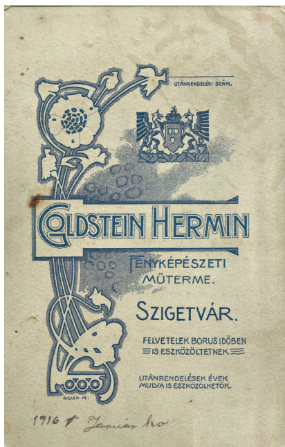
Verso Goldstein Hermin egyik felvételéről – saját gyűjteményből

közös fényképészeti műterme, 17 amely 1901-ben fényképészeti szolgáltatások mellett képes levelezőlapokat is kibocsátott. 18