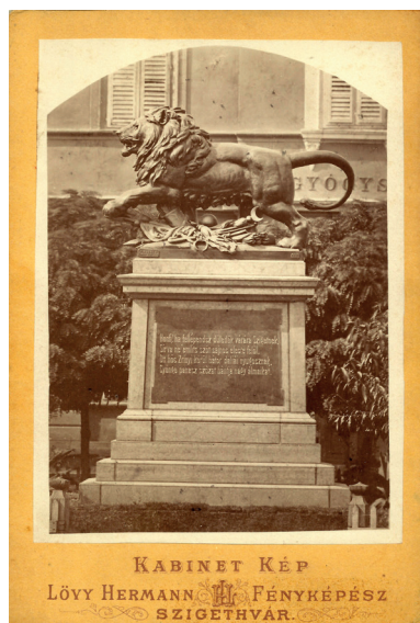
Oroszlán-szobor; Lövy Hermann felvétele, 1890-es évek körül – saját gyűjteményből

A portrék és városfotók mellett akadt még egy területe a szakmának, amelyben Lövy már a 19. század végén is tevékenykedett: az állatfotózás. Egy külföldi gyűjteményben ugyanis fennmaradt egy kép, amelyen egy kutya, feltehetően egy Spaniel látható ülő helyzetben. 13 Köztudott tény, hogy a 19. század végén még hosszú, több másodperces expozícióval készültek a képek, többnyire üveglemezre; a fotográfia messze nem volt olyan szinten technikailag, mint a két háború közötti időszakban, illetve az utána következő évtizedekben. Ha egy fényképész ilyen feltételek