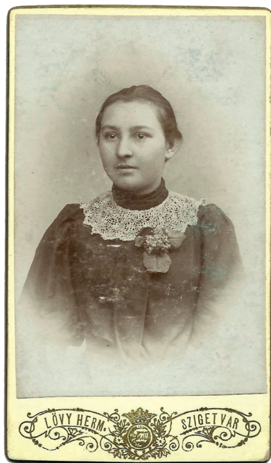
Vizitkártya; nő portréja, Lövy Hermann felvétele – saját gyűjteményből

Lövy Hermann a portrék mellett készített képeket Szigetvár ut-cáiról és tereiről is, az ő városfelvételei kerültek rá az első szigetvári fényképes levelezőlapra. 12 Az említett képeslapon három foto szere-pel: Turbék képe, a vár oldalnézetből, valamint az Oroszlán-emlék-mű fotója. Utóbbiról fennmaradt egy sárga versóra ragasztott, foto-papírra nagyított példány is, amely valamikor az 1890-es években